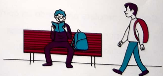
Darío lo esperó sentado en un banco.