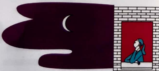
Marta la ve desde la ventana.